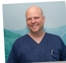
Text: KK

nischen Problemen und steigert das Wohlbefinden im eigenen Körper. In der Mund-, Kiefer-, und Ästhetischen Gesichtschirurgie ist die indikationsgerechte Behandlung mit Botox ein etabliertes Verfahren und wird in unserer Praxis oft angewandt. In unserer Spezialsprechstunde empfangen und beraten wir Sie gerne. ■