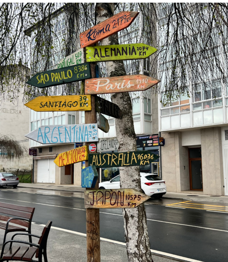
Die Kathedrale von Santiago de Compostela ist das markante Ziel der Pilgerreise (o.r.). Wer seinen Pilgerpass (o.l.) fleißig gestempelt hat, bekommt am Ende eine Urkunde (Compostelana).