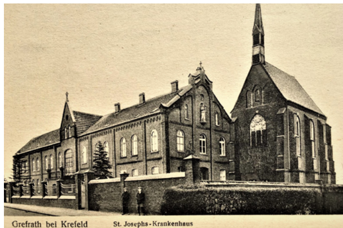
Grefrath bei Krefeld St. Josephs-Krankenhaus