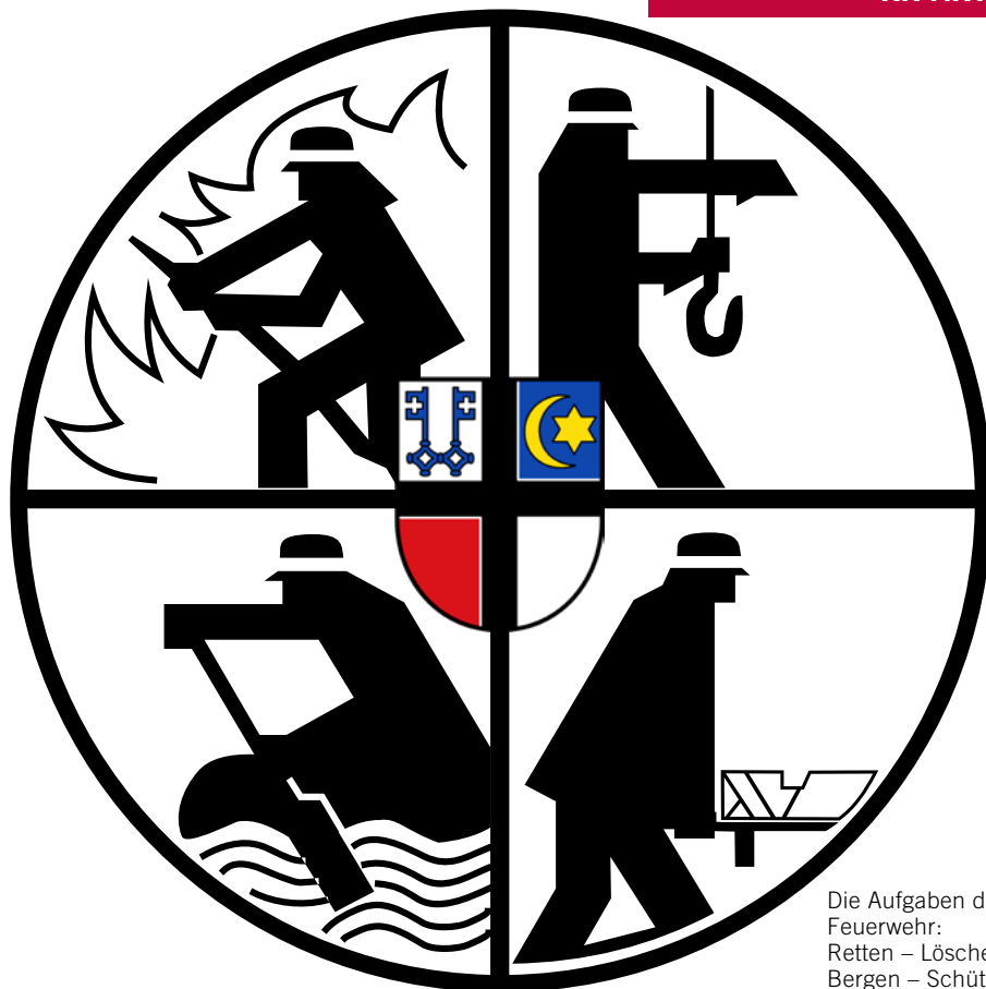
Die Aufgaben der Feuerwehr: Retten – Löschen – Bergen – Schützen

Text: Wolfgang Wiese