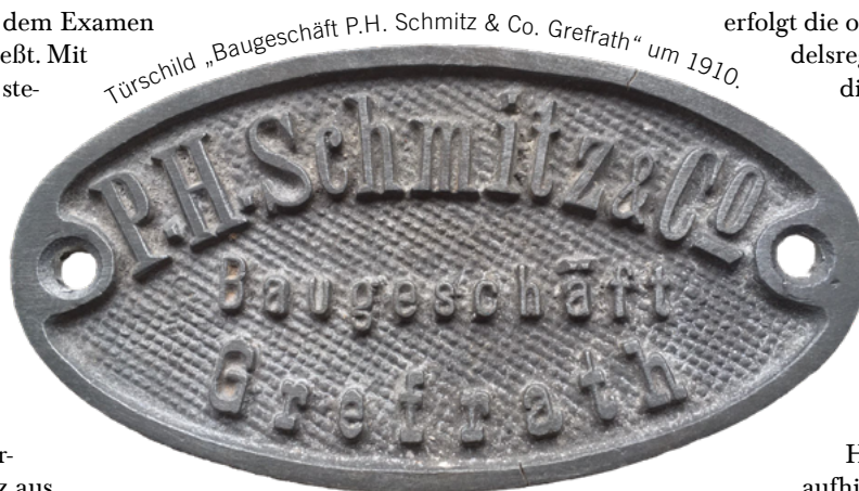
Türschild „Baugeschäft P.H. Schmitz & Co. Grefrath“ um 1910.

junktur wieder. Sein größtes Projekt in dieser Zeit: der Bau der neuen Knabenschule, der späteren Haupt- oder Martinschule (2019